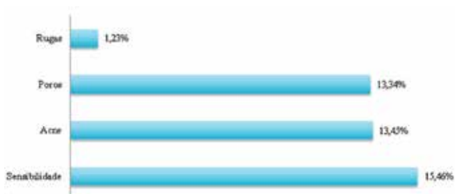
GRÁFICO 1: Média da melhora de cada variável com laser toning + placebo comparando tempo zero com 15 dias após o término do tratamento